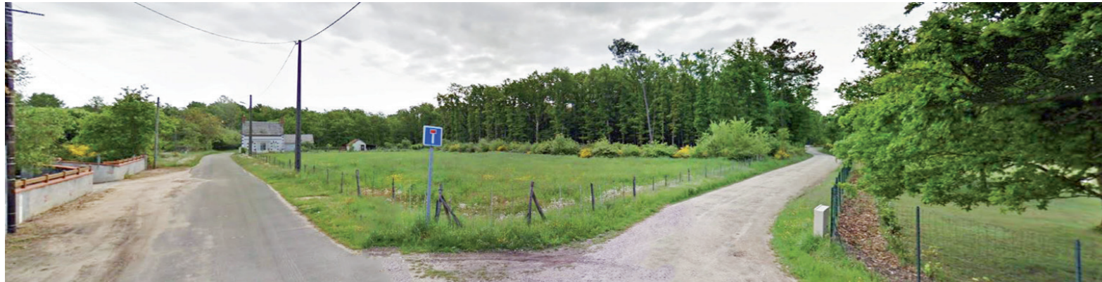
Paysage lointain 2 : Vue en direction de l'aire immédiate depuis le nord-est, depuis la périphérie de la zone urbanisée.