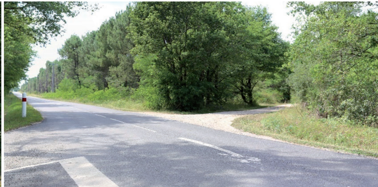
Paysage lointain 4 : Vue en direction de l'aire immédiate depuis la RD54 à 350m à l'est