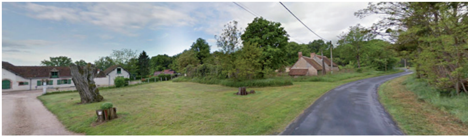
Paysage lointain 1 : Le bâti de la Garenne, dans un contexte arboré fermé.