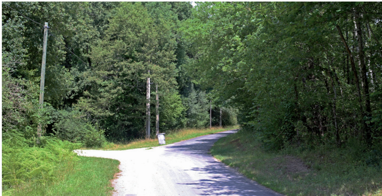
Paysage lointain 3 : Entrée du Launay Picot depuis le chemin autour de l'aire immédiate.